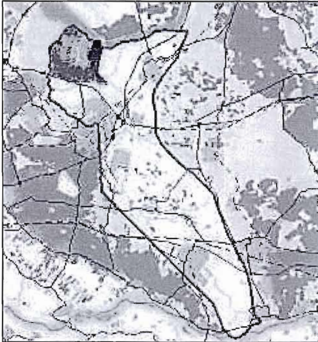
Figuur 1.2: Bres bij Wageningen: schade € 10 mld. en 100 tot 1000 slachtoffers