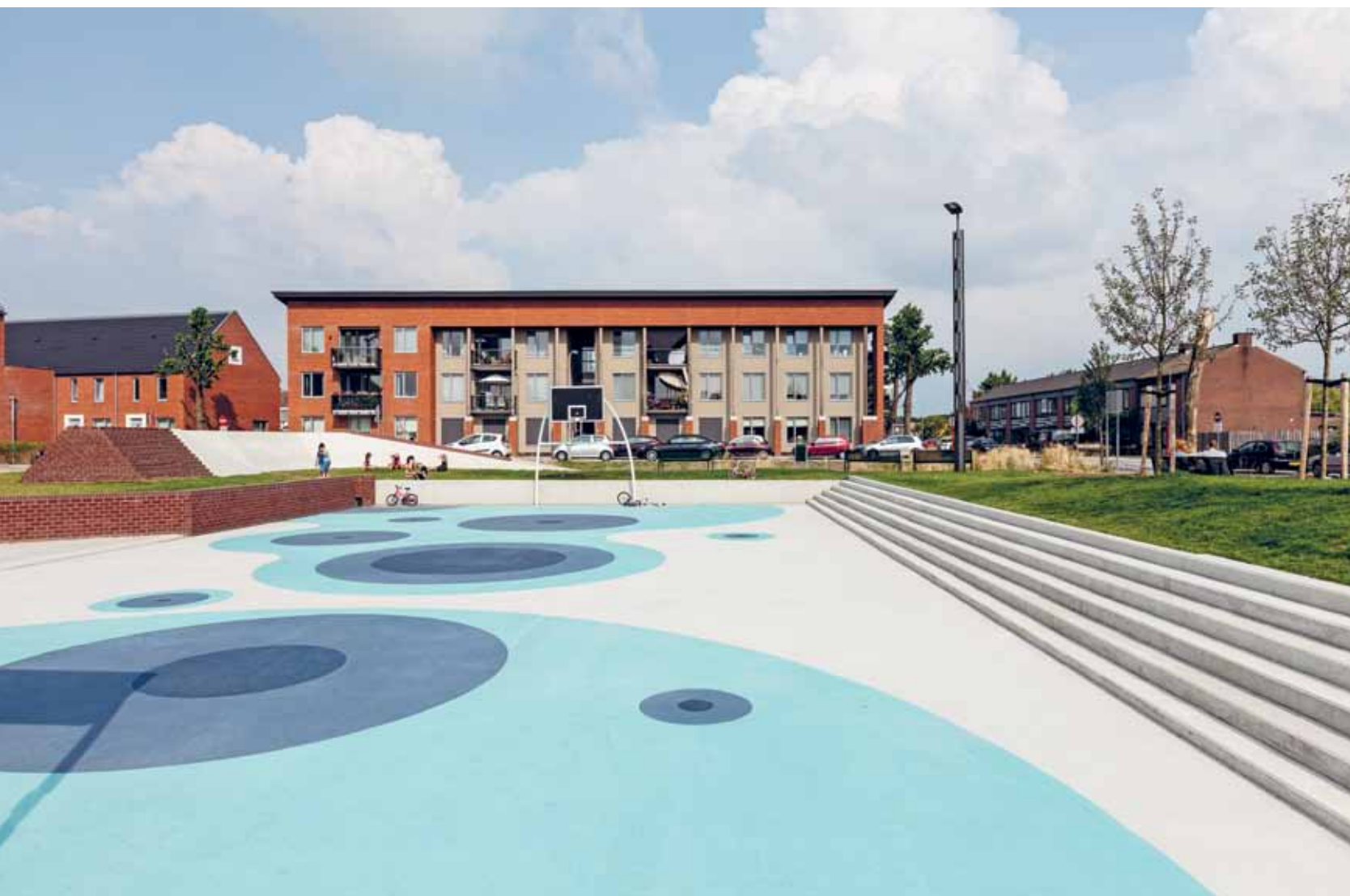
Het grootste bassin is vormgegeven als een sportplein.

Het waterplein in Tiel is onmiskenbaar een zusje van het Rotterdamse prototype, zowel qua systeem als qua vormgeving