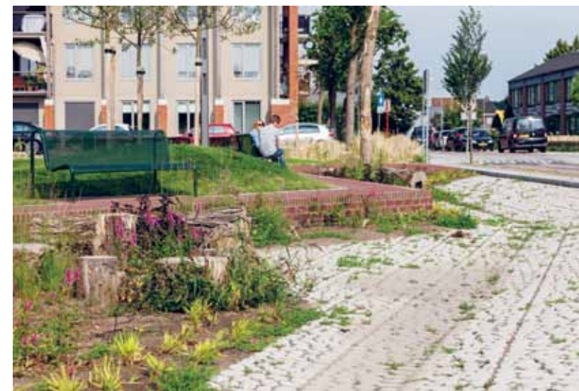
De natuurlijke bassins lopen vol bij een regenbui.