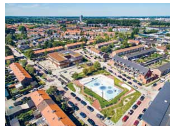
De ligging van het plein in de Tielse Vogelwijk.

groen. Met de sloop van het schoolgebouw en de kerk ontstond de ruimte om hier een plein te maken dat de waterbergende functie combineert met ruimte voor spel en sport.