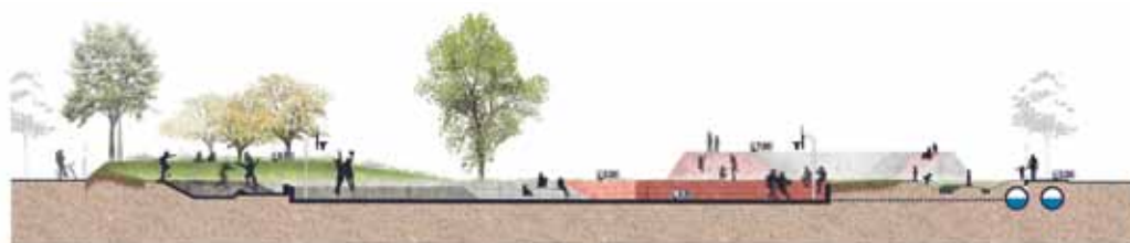
Doorsnedes van het plein.