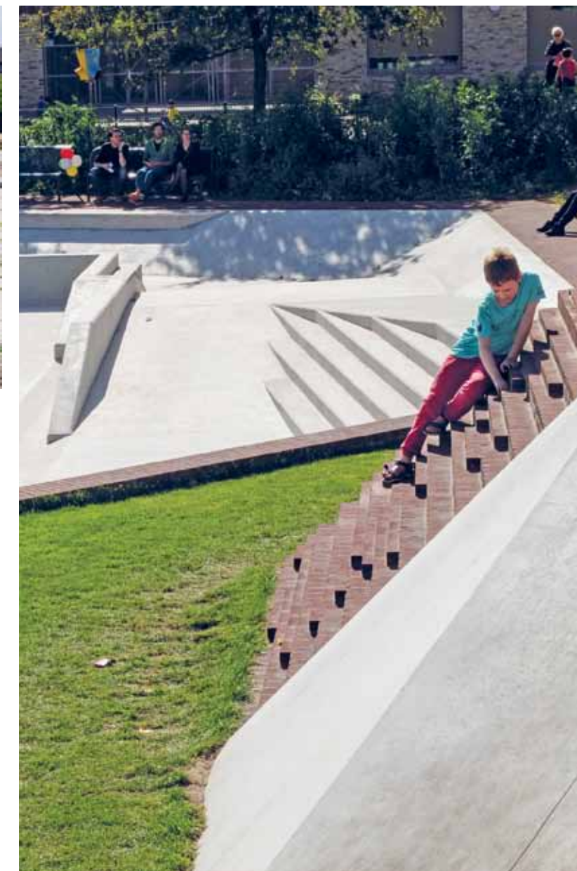
Een kind beklimt de kop van de 'slang'.