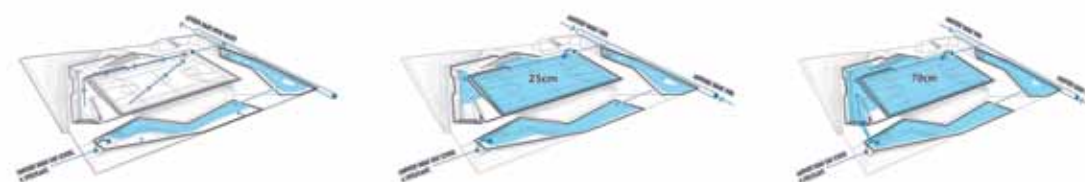
Het principe van het waterplein: eerst lopen de natuurlijke bassins aan de randen vol, daarna de grote bassins op het plein.

Tekst Hannah Schubert