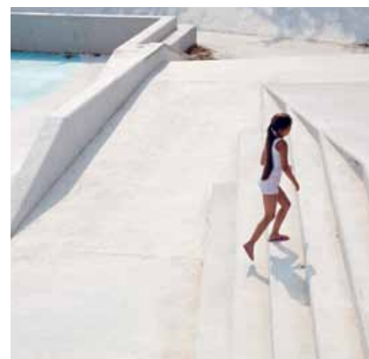
De randen dienen ook als tribunes en zitranden.

het diepere deel zich vanuit het hemelwaterafvoersysteem, en het plein loopt leeg als daar weer ruimte in is – daar is geen pomp voor nodig. Het waterplein in Tiel is onmiskenbaar een zusje van het Rotterdamse prototype, zowel qua systeem als qua vormgeving, met zijn witbetonnen randen en coating in blauwtinten. Het 'grootstedelijk karakter' lijkt in Tiel echter wat uit zijn context. Ondanks de herstructurering is de omgeving toch vooral kleinstedelijk. Daar staat tegenover dat het Waterplein Tiel als onmiskenbare blikvanger in de wijk ligt, en als ontmoetingsplek voor de hele buurt dient.