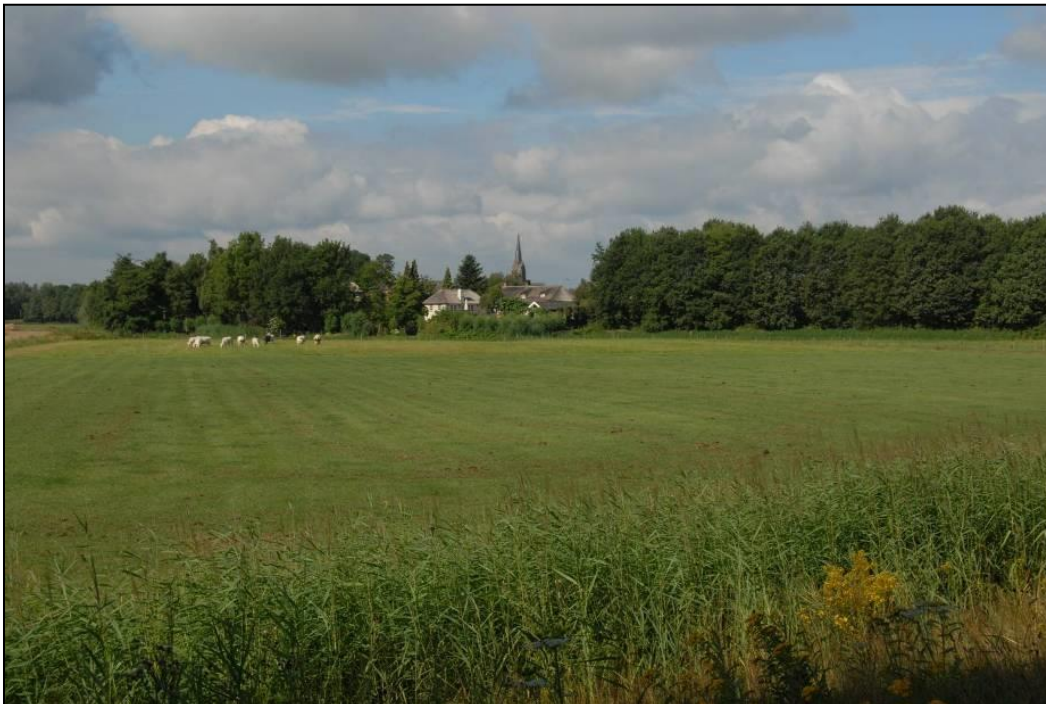
Foto 2: Zicht op de Biessertpolder met de bebouwing van Vlijmen op de achtergrond

- De oorspronkelijk bedoelde verlegging (kortsluiting) van de Bossche sloot door de Biessertpolder is uit de plannen gehaald; dit zat wel in de aanvraag, maar is door voortschrijdend inzicht geschrapt. Er blijkt namelijk een kerosineleiding van Defensie door de Biessertpolder te lopen en ook zouden diverse andere leidingen (gas, riool, data, elektriciteit) moeten worden gepasseerd (hoge kosten). Vanuit natuurontwikkelingsoogpunt bezien is de verlegging van de Bossche sloot eveneens onwenselijk: het zou kunnen leiden tot versnelde drainage van het projectgebied, terwijl het waardevolle (gebiedseigen) kwelwater zo lang mogelijk in het gebied dient te blijven. Bovendien zal vermenging optreden van voedselrijk water uit de Bossche sloot met waardevol kwelwater in het projectgebied.