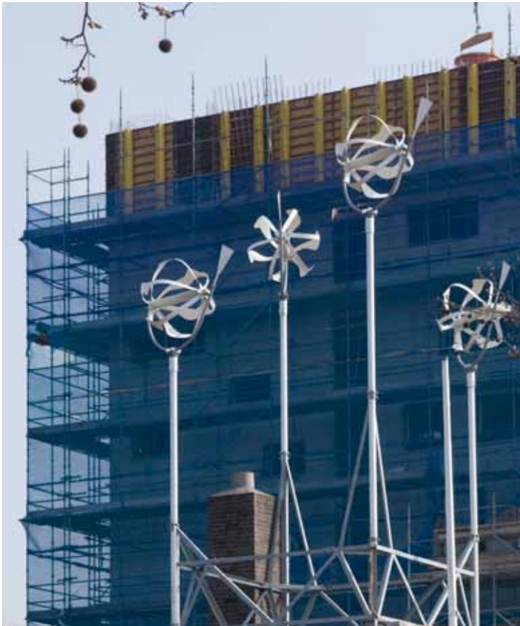
Windenergie helpt Tilburg bij het behalen van energiedoelen.