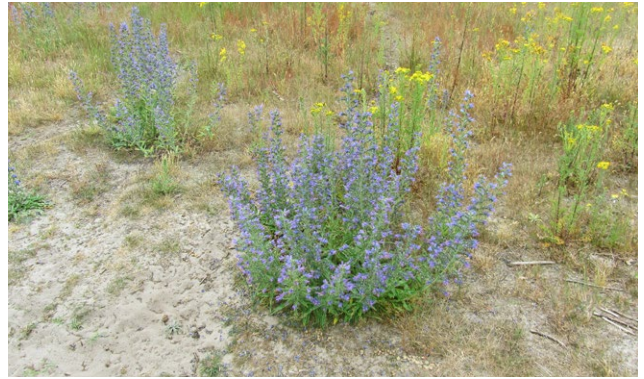
7 Kruidenrijk grasland