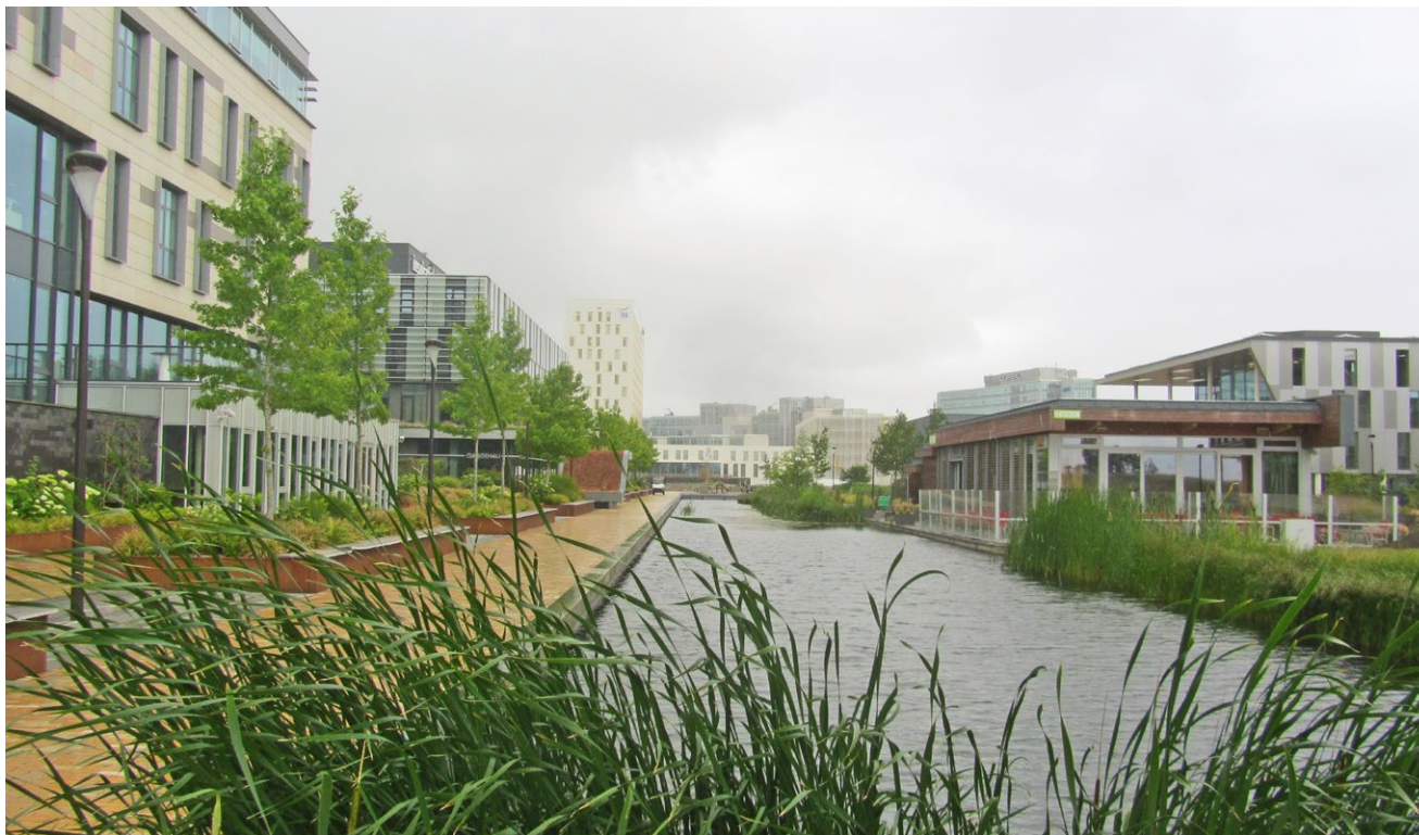
1 Open water