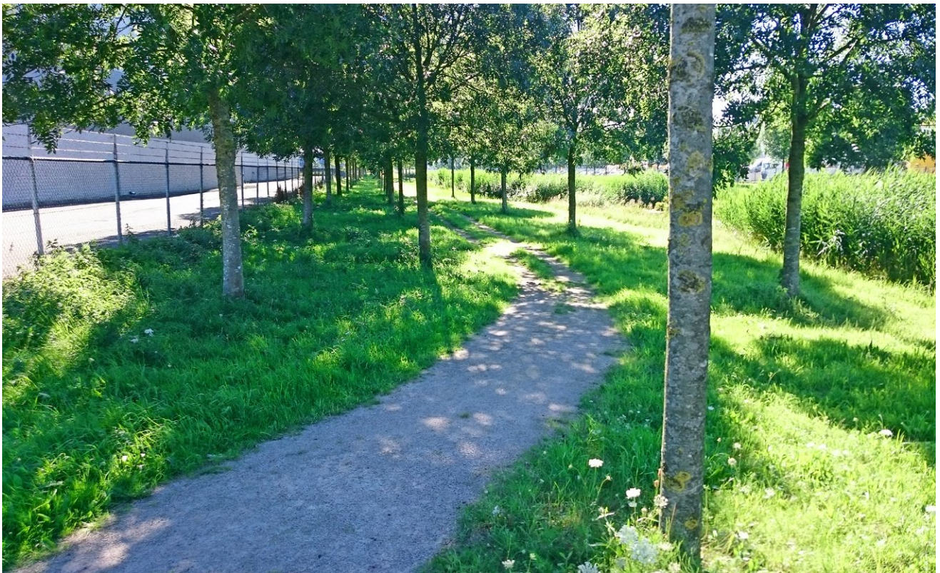
4 Inheemse bomen