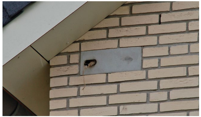
5 Faunavoorziening inbouwkast gierzwaluw