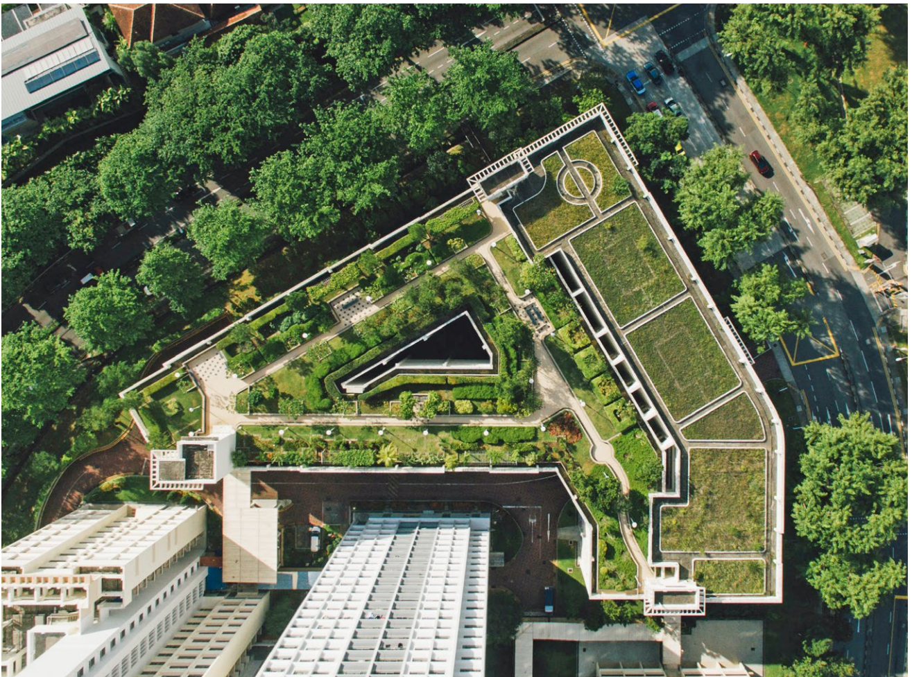
10 Natuurlijke bedrijfskavel