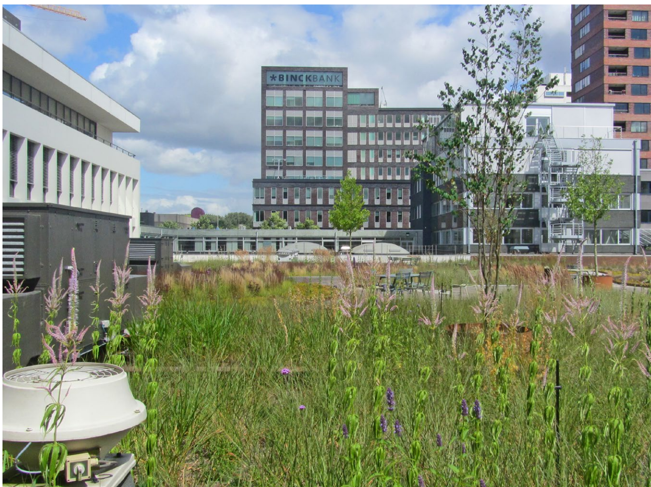
2 Groen/blauw dak