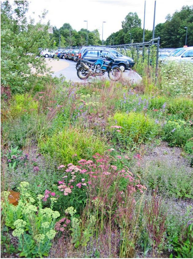
9 Vaste planten rondom parkeerterrein