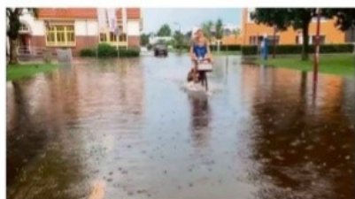
Van Helomalaan, Heerenveen.