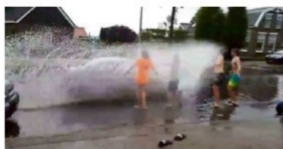
Meyerweg, De Knipe.