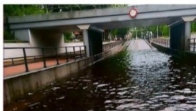
Tunnel Koornbeursweg, Heerenveen.