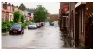
Hoek Badweg/Breedpad, Heerenveen.