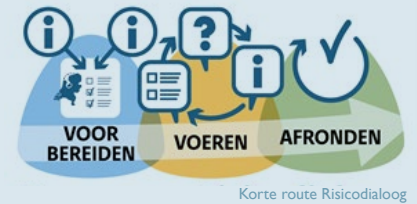
Korte route Risicodialoog

Op deze pagina staan nog enkele andere vormen van samenwerken die gekozen kunnen worden afhankelijk van strategie en complexiteit van de opgave.