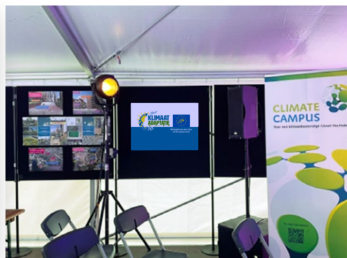
Voorbeeld van het gebruik van een poster, op 23 september 2022, tijdens een openbare bijeenkomst van de Climate Campus in Zwolle