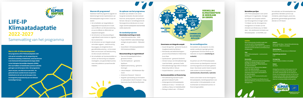
Voorbeeld van een folder (staat ook op het Kennisportaal Klimaatadaptatie)