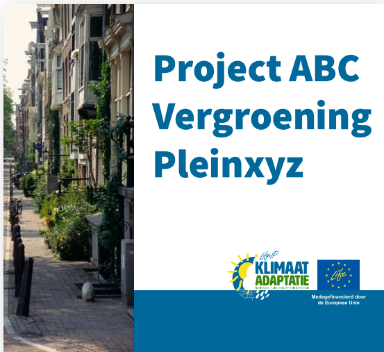
Voorbeeld van een informatiebord