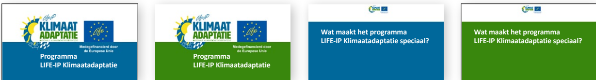
Voorbeelden van slides in een PowerPoint-presentatie (te vinden in de samenwerkingsruimte)