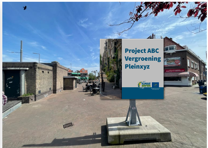
Voorbeeld van het gebruik van een informatiebord