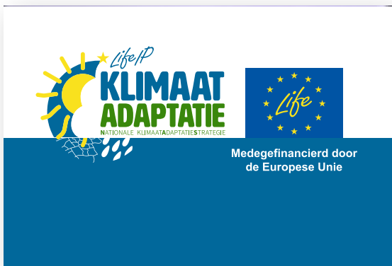
Voorbeeld van een poster