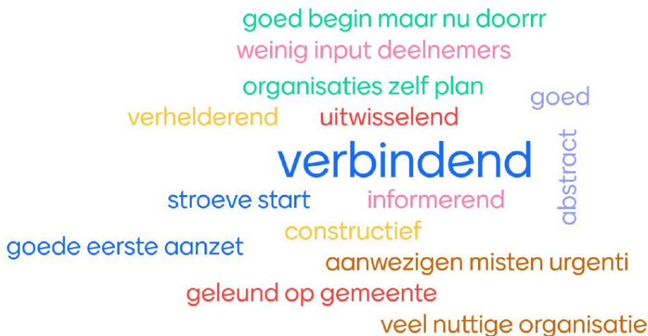
Figuur 2: Screenshot uit de gezamenlijke evaluatiesessie van 8 november 2022: ervaringen met het gespreksverloop.