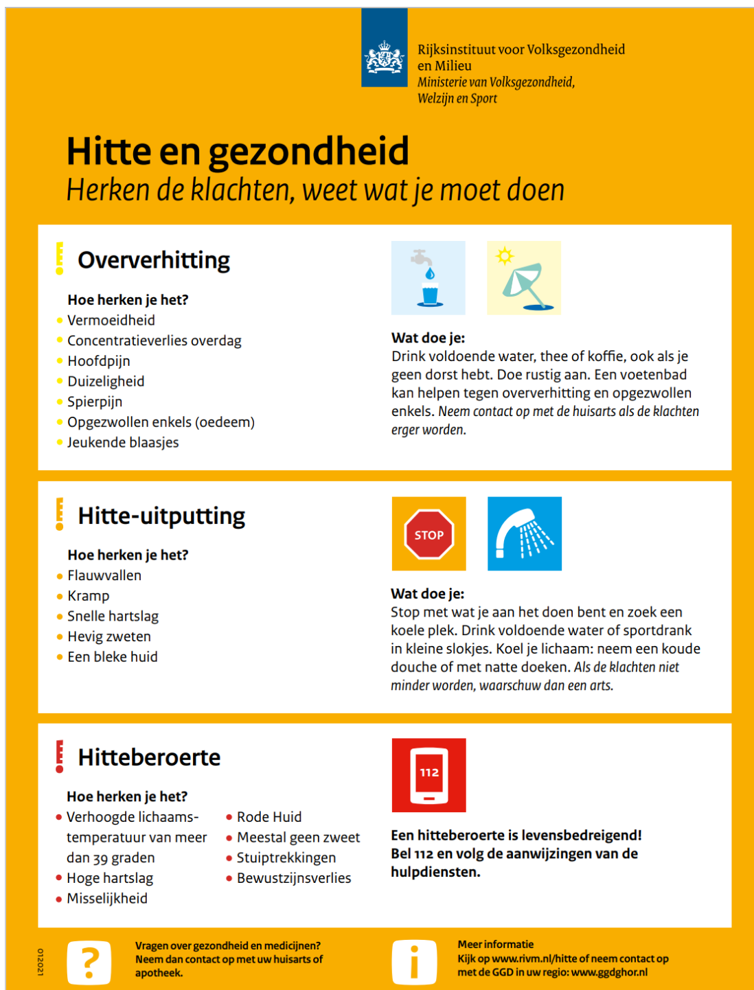
Figuur 5: Infographic 'hitte en gezondheid'.

De effectiviteit van een lokaal hitteplan is moeilijk te meten. Er is nog geen goede indicator voor de vermindering van productiviteitsverlies en welzijn. Oversterfte is alleen achteraf en globaal vast te stellen, en biedt geen beeld van de effectiviteit. De GDD is nog op zoek naar een goede indicator of indicatoren.