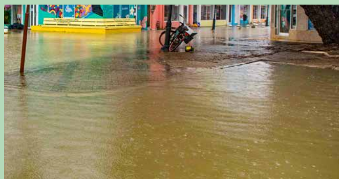
Nu al heeft Bonaire te maken met zwaardere regenbuien en een sterkere golfslag.