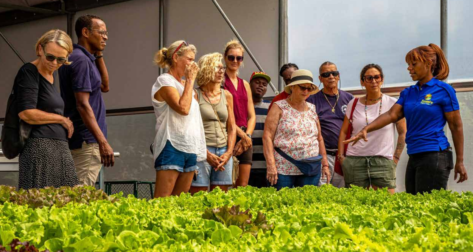
De open dagen worden steeds drukker bezocht.

verzamen om een beter inzicht te krijgen op basis waarvan we de visserij kunnen ondersteunen. De tuinbouwafdeling wordt versterkt om het telen door particulieren op eigen erf en in wijken aan te moedigen en te faciliteren.”