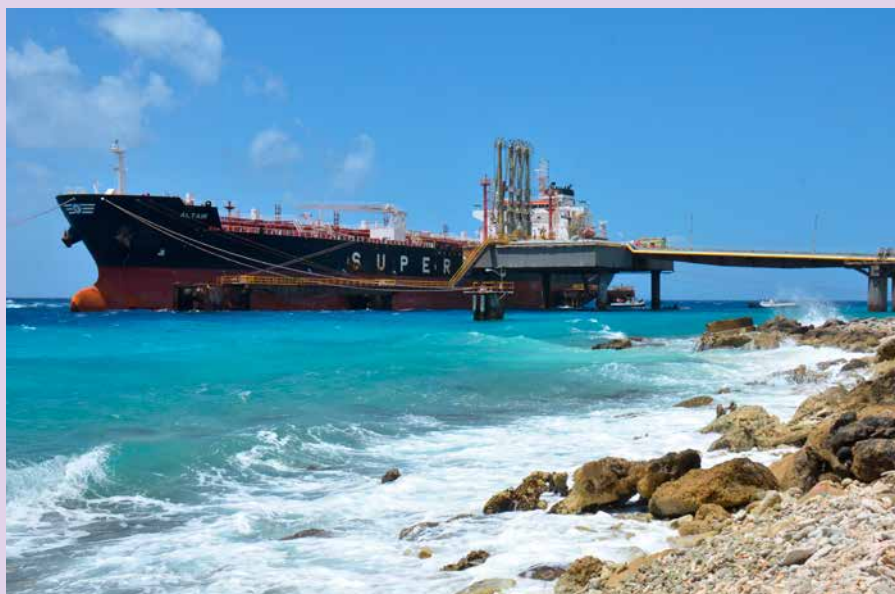
Een memorabel moment voor alle betrokkenen: in maart ontving de terminal voor het eerst in drie jaar weer een tanker.

in elk geval het loon van het skeletonteam te kunnen betalen. "Toen dat geregeld was, konden we verder. Doordat er onvoldoende was geïnvesteerd in onderhoud, was er voor faillissement een aantal overtredingen geconstateerd door de Inspectie voor Leefomgeving en Transport en Rijkswaterstaat. Door het los- en laadverbod op jetty 1 konden we niets met de opgeslagen olie en viel er dus ook geen geld te verdienen, temeer daar de vorige en huidige eigenaren van de olie niet betalen voor de opslag. Omdat Bopec anderzijds wel gedwongen is de bewaarneming van olieproducten continue voort te zetten, zijn we verschillende gerechtelijke procedures gestart tegen deze eigenaren." Met behulp van het litigation team van het kantoor van de curator - HBN law & Tax - verloopt dit voortvarend.