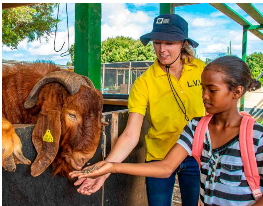
Het doel is alle geiten achter een hek te krijgen.

Voor de kas komt nog een welkomstcentrum met een klein restaurant waar verse salades worden geserveerd en de rondleidingen door de kas beginnen met een korte introductie. Als dan ook nog de zonnepanelen geïnstalleerd zijn, start fase 2. "We zijn samen met LVV de plannen voor een tweede kas voor tomaten en boontjes aan het uitwerken. Ik ben al aan het tekenen", aldus Janssen.