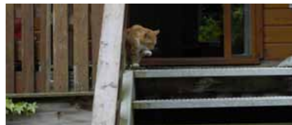
Huis van Bartels

Stichting Het Huis van Bartels is een buurtorganisatie in de nieuwbouwwijk Het Hogekwartier met als thuisbasis een voormalige kwekerij, een groene oase met struinpaden voor kinderen, een biologische buurtmoestuin en een grote diversiteit aan planten, bomen en insecten. Het plan is dat deze open ontmoetingsplek te zijner tijd plaats moeten maken voor nieuwbouw, maar tot die tijd vinden er uiteenlopende culturele