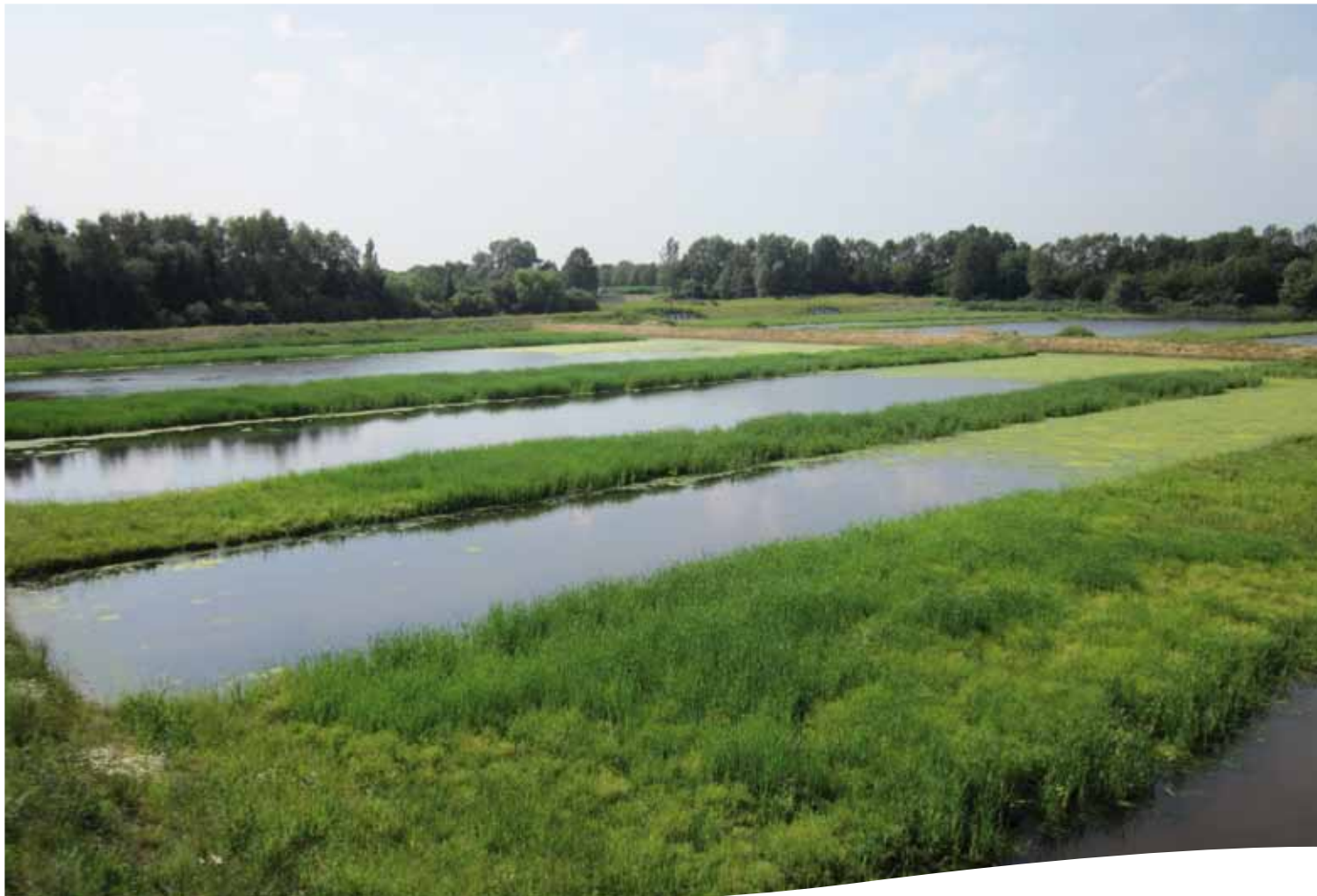
Het Kristalbad biedt nieuwe natuur en ruimte voor water tussen Enschede en Hengelo.