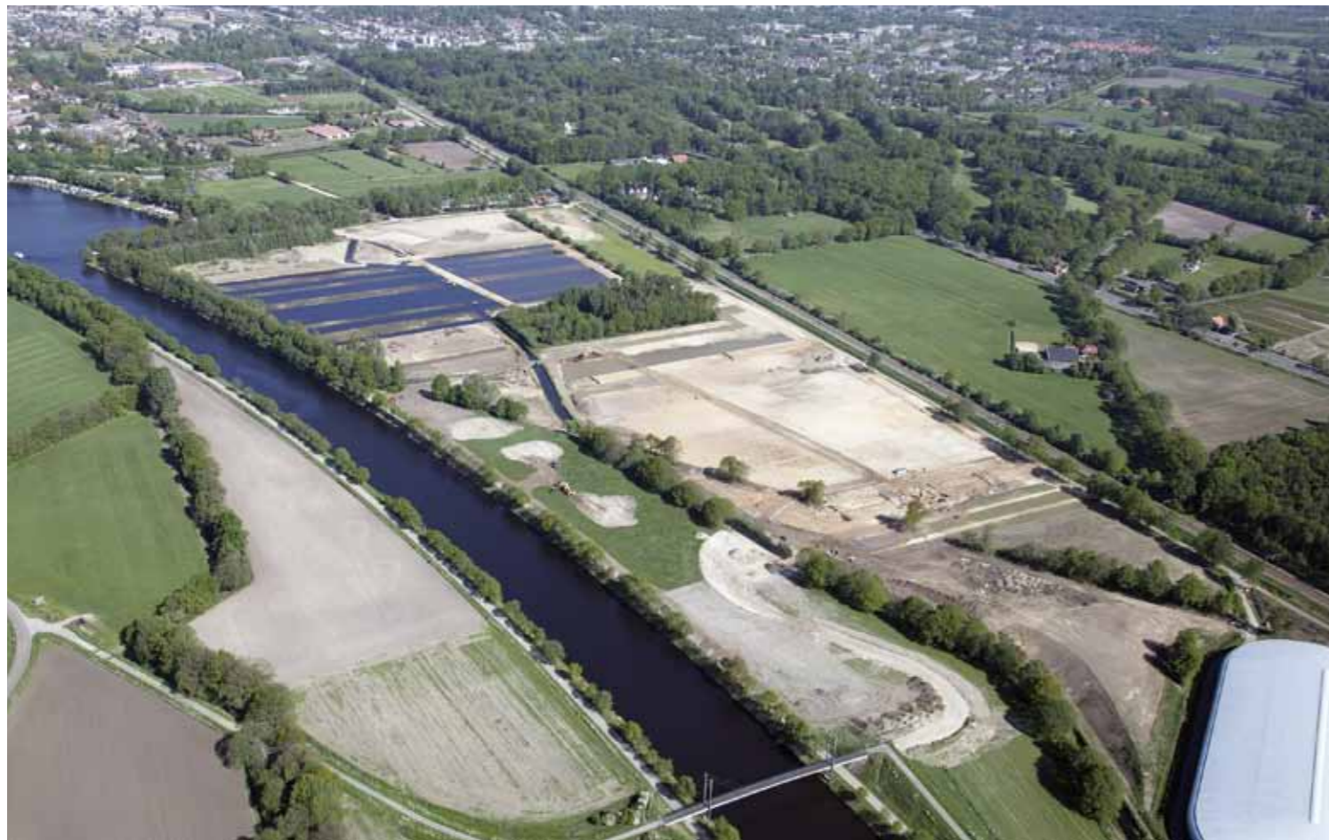
Luchtfoto mei 2011