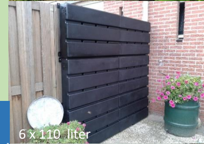
6 x 110 liter