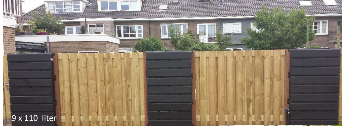
9 x 110 liter