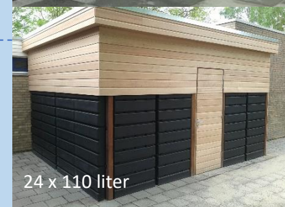
24 x 110 liter