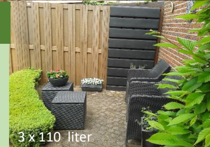
3 x 110 liter

De Rainwinner® bergt overtollig hemelwater, afkomstig van daken, op een slimme manier. Hij neemt nauwelijks ruimte in beslag, is modulair opgebouwd waardoor de opslagcapaciteit naar behoefte kan worden afgestemd, niet perse in de buurt van de regenpijp hoeft te worden geplaatst en er kunnen diverse uiteenlopende functionele objecten van gebouwd worden met verrassende secundaire voordelen als brandpreventie, geluid reducerend en bewustzijn bevorderend (stimuleert het aanbrengen van meer 'groen' in tuinen).