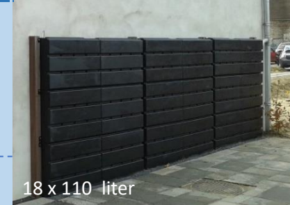
18 x 110 liter

De Rainwinner® kan geheel of gedeeltelijk deel uitmaken van een infiltratiesysteem. voordelen: bewustwording, kostenbesparend, combinatie met het gebruik van hemelwater is mogelijk en de infiltratiecapaciteit is snel en eenvoudig door de gebruiker zelf te controleren.