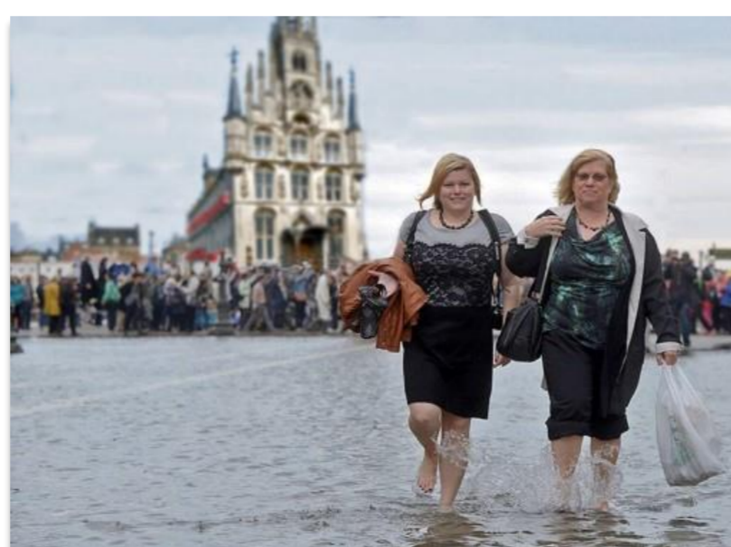
Impressie klimaatverandering in Gouda

* De keuze om de gesprekken met eigenaar bewoners primair te richten op het verhelpen van bestaande overlast was geen truc om zo via de achterdeur in gesprek te komen over het KBB (dat zou ook niet werken). De bestaande overlast is urgent en het KBB brengt pas op z'n vroegst over 5 jaar verbetering. Aanpak op korte termijn is gewenst en daarmee dus ook een goed gespreksonderwerp. Ook belangrijk is het te realiseren dat de mensen in de binnenstad (gek genoeg?) over het algemeen niet boos zijn over de overlast die ze ondervinden. Dat is ook een belangrijke randvoorwaarde om in gesprek te komen zoals dat bij dit project gelukt is.