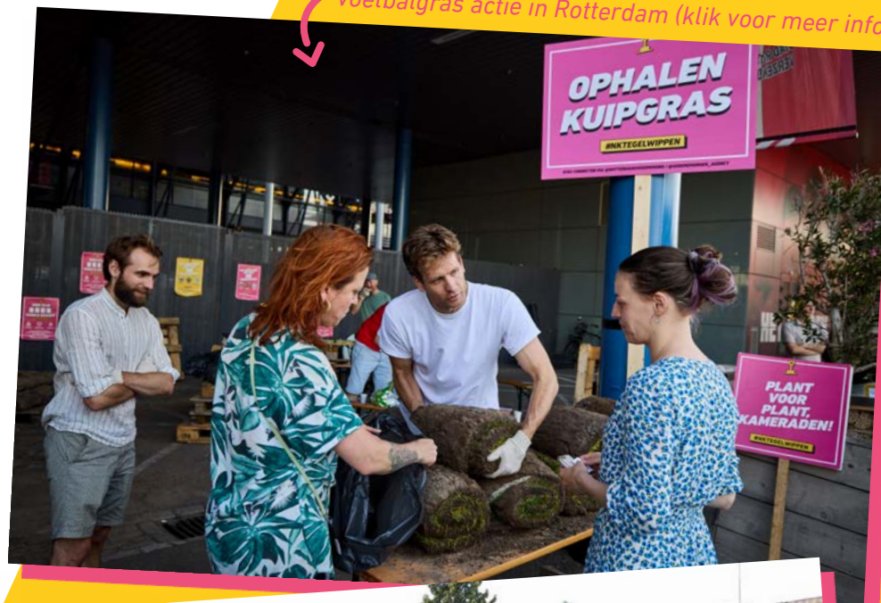
Voetbalgras actie in Rotterdam (klik voor meer info)

Geef je acties ook door aan de NK Tegelwippen organisatie via info@nk-tegelwippen.nl .