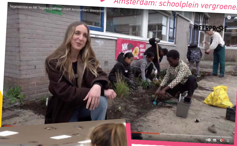
Afttrap actie NK Tegelwippen in Amsterdam: schoolplein vergroenen