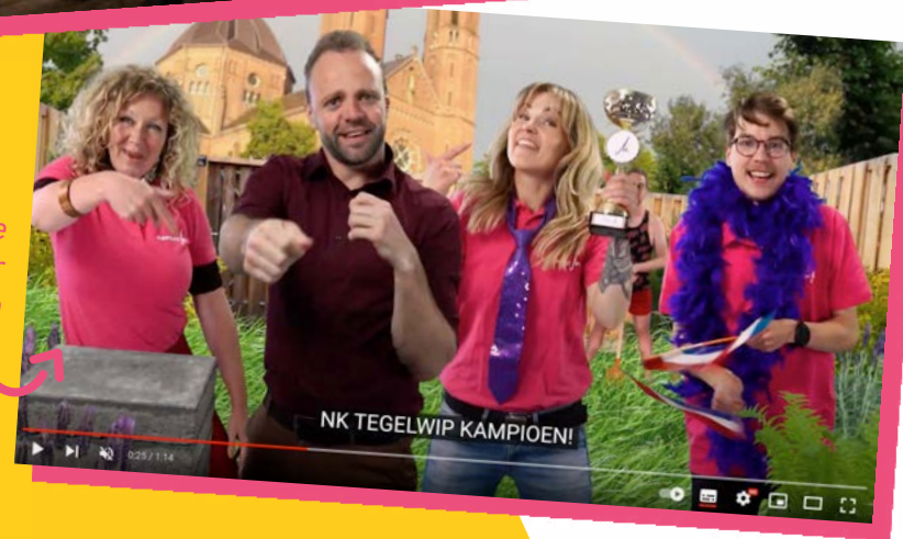
Rappende wethouder incl. videoclip in Maashorst