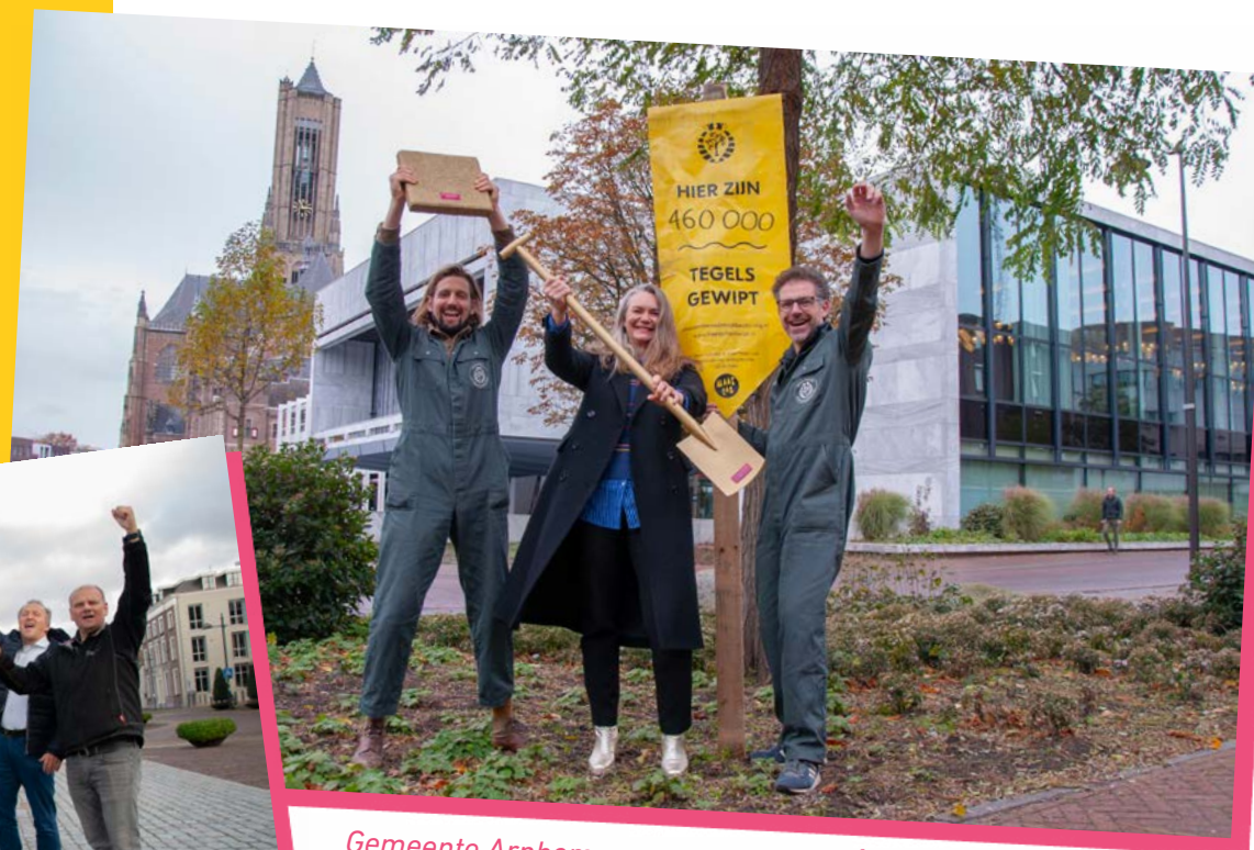
Gemeente Arnhem won een Gouden Schep én de Gouden Tegel in 2023 ↗

Als het hoofddoel is om te winnen geef dan vooral ook gewipte tegels uit de openbare ruimte door. Is het motiveren van bewoners het hoofddoel? Focus dan op hoe je bewoners kan bereiken.